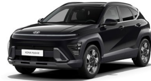
Abyss Black Pearl Perleťová Cena: 17 900 Kč