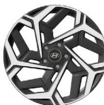
Unikátní N Line 18" kola z lehké slitiny

www.porovnejhyundai.cz (Porovnejte si vozy Hyundai s konkurencí)