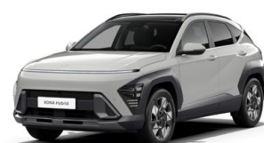
Cyber Gray Metallic Metalická Kombinace dostupná také s černým lakováním střechy Cena: 17 900 Kč