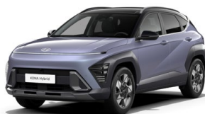
Meta Blue Pearl Perleťová Kombinace dostupná také s černým lakováním střechy Cena: 17 900 Kč