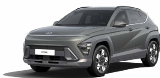
Amazon Gray Metalická Kombinace dostupná také s černým lakováním střechy Cena: 17 900 Kč