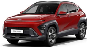
Ultimate Red Metallic Metalická Kombinace dostupná také s černým lakováním střechy Cena: 17 900 Kč