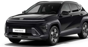
Abyss Black Pearl Perleťová Cena: 17 900 Kč