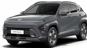
Ecotronic Gray Pearl Perleťová Kombinace dostupná také s černým lakováním střechy Cena: 17 900 Kč