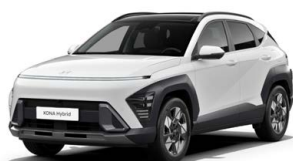
Atlas White Pastelová Kombinace dostupná také s černým lakováním střechy Cena: 9 900 Kč